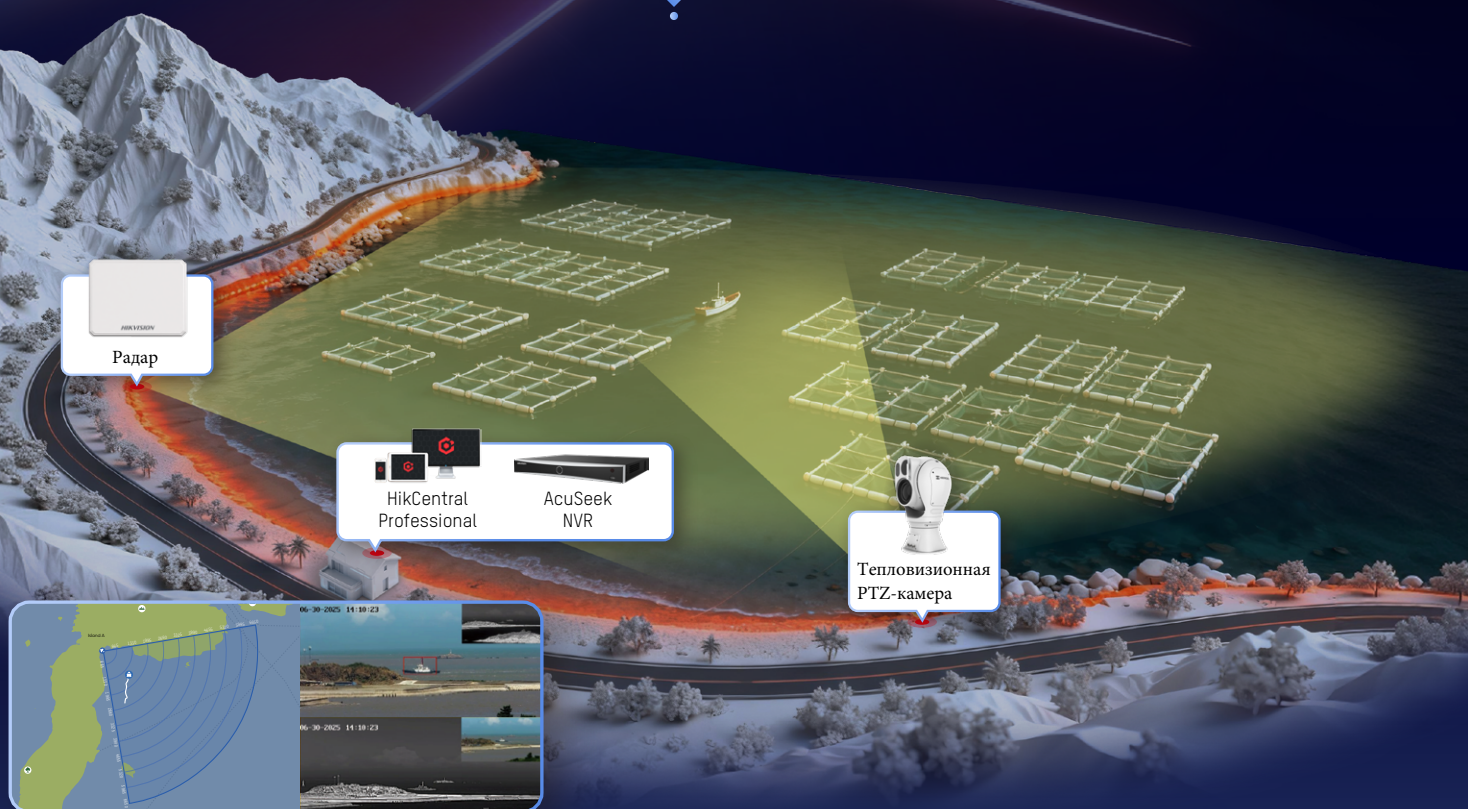
Детектирование радаром и сопровождение целей камерой

Мы поставляем радиолокационные и тепловизионные системы позиционирования для зон марикультуры, которые позволяют обнаруживать, отслеживать и предотвращать несанкционированное вторжение судов, незаконную швартовку или хищение.